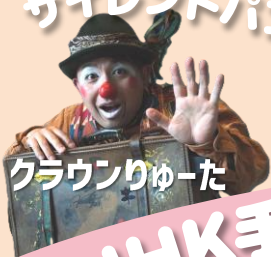
クラウンリゅーた